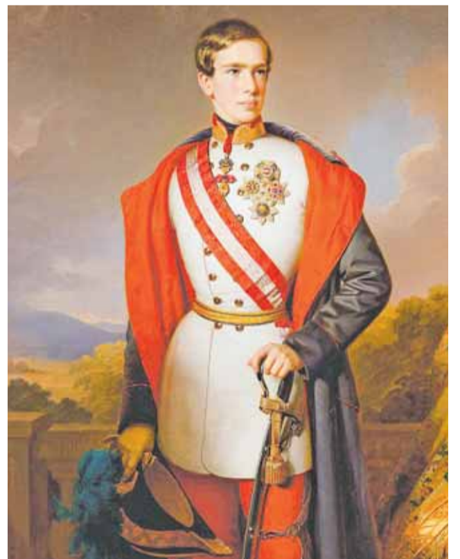
I. Ferenc József osztrák császár portréja 1849-ből

szakadt Magyarországot, a királyi koronát azonban maga nem fogadta el, sőt később formálisan is lemondott az igényéről. Másodszer, az 1707. évi ónodi országgyűlésen a nemzeti függetlenség visszaállítása mellett azért fosztották meg trónjától I. Józsefet, hogy II. Rákóczi Ferenc ezzel is elnyerje francia szö-