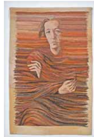
Gobelinteknikával szövött falikárpit – Tisztelet Ferenczy Noéminek, Polgár Rózsa, 1990–1991, Magyarország

Polgár Rózsa itt látható másik szövésének befogadását is sokban segítheti, ha van némi lexikális ismeretünk a címében megidézett Ferenczy Noémiről : a munkáit a középkori alkotók mintájára maga tervező és kivitelező gobelinművészről, a „türelmes jelenlét” alkotói magatartásáról, mikor a művész mintegy beleszövi idejét, testét, szellemét a műbe. De nem indíthat minket izgalmas asszociációkra ezek nélkül is a kárpitba fonódó ember ábrázolása? Fontos ismernünk a nemzeti törekvéseket a századvég művészetében ahhoz, hogy értelmezni tudjuk a fentebb látható vázán a 10. századi bizánci textilekről másolt millenniumi ornamentikát? Lebilincselő történet, hogyan kotyvasztották ki a Zsolnay vegyknahájában a mintát és az ezredéves országos látlat látogatói: fémcs fenyű mázakkal imitáltak olyan textilmustrát, amit közmegegyezéses alapon „magyarosnak” tartottak az ősi gyökereiket kereső kortársak.