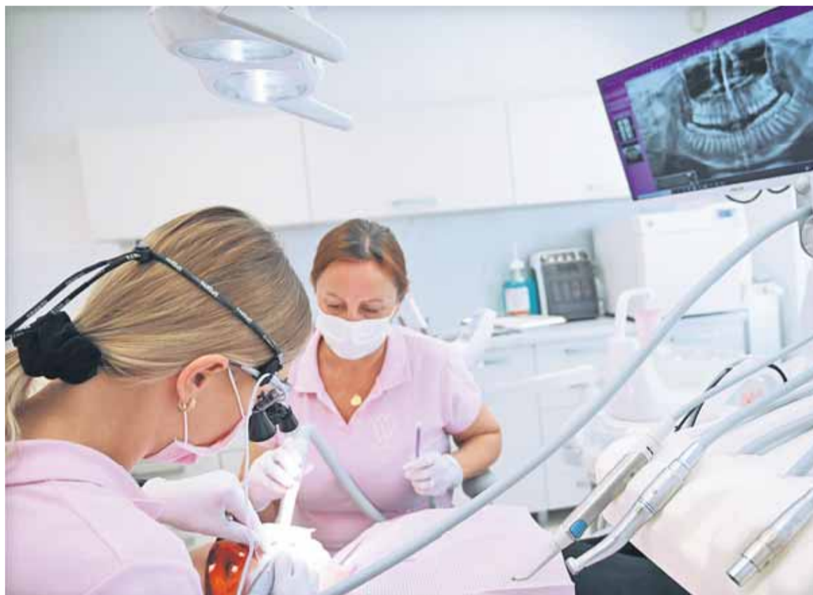
2023-ban a biztosítók összesen 45,8 millió eurót fizettek ki a fogászati kedvezményekre

Az egészségbiztosítók adatai alapján a fogászati támogatások kifejezetten népszerűek voltak a betegek körében: 2023-ban az összes kifizetett kedvezmény mintegy háromnegyedét tették ki. Az egészségügyi minisztérium elismerte, hogy a múltban hozzá is járultak a szűrővizsgálatok számának növekedéséhez, a friss elemzések azonban már azt mutatják, hogy nem érik el a kívánt hatást, ezért most új támogatási rendszerek kidolgozására ösztönzik a biztosítókat. Az ellenzék élesen bírálta Zuzana Dolinková egészségügyi minisztert a támogatás eltörlése miatt, állítása szerint azonban erről nem ő, hanem a biztosítók döntöttek. Az utolsó kérvények benyújtására eltérő határidők vonatkoznak az egyes biztosítóknál, erről bővebben a második oldalon olvashatnak.