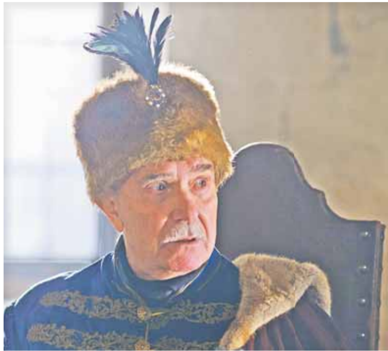
Károlyi tábornok szerepében, a Hadikban