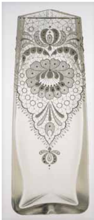
Csiszolt, formába fűvott szintelen üvegváza, Csipkeüveg Parádi Üvegyár, 1920, Parád

Kövessük csak az esernyőjét – hiszen ez a gondolat ahhoz a logikus megállapításhoz repítheti az embert, hogy a műélvezet képessége az alkotás típusától függetlenül is alapvető emberi tulajdonság kell, hogy legyen. A tudomány mindenesetre, amelyik egyaránt igyekszik fogást találni a diszvázán és a szonettkoszorún, örömmel használ az eltérő művészeti ágak leírására közös eszközöket. Az ikonográfia például, amit Bodor Béla a költői kép működését vizsgálva hívott segítségül, szándéka szerint a képek tudománya: az ábrázolások, történetek, allegóriák azonosítására szolgál. Erwin Panofsky német művészettörté-