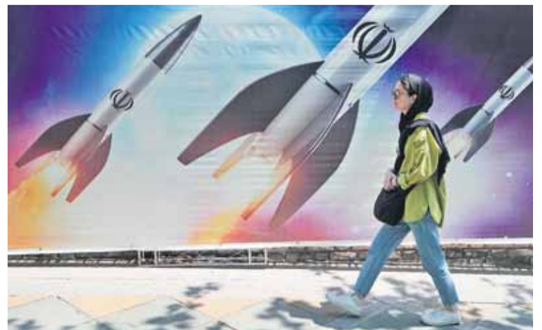
Teheráni utcakép. Harci lázban égnek a falra festett iráni rakéták.

Iszfahán stratégiai városnak számít, ahol katonai bázisok találhatóak, nukleáris kutatási és fejlesztési központok, és a hadsereg elit egységének, a Forradalmi Gárdának is ott van a támaszpontja. E városban ta-