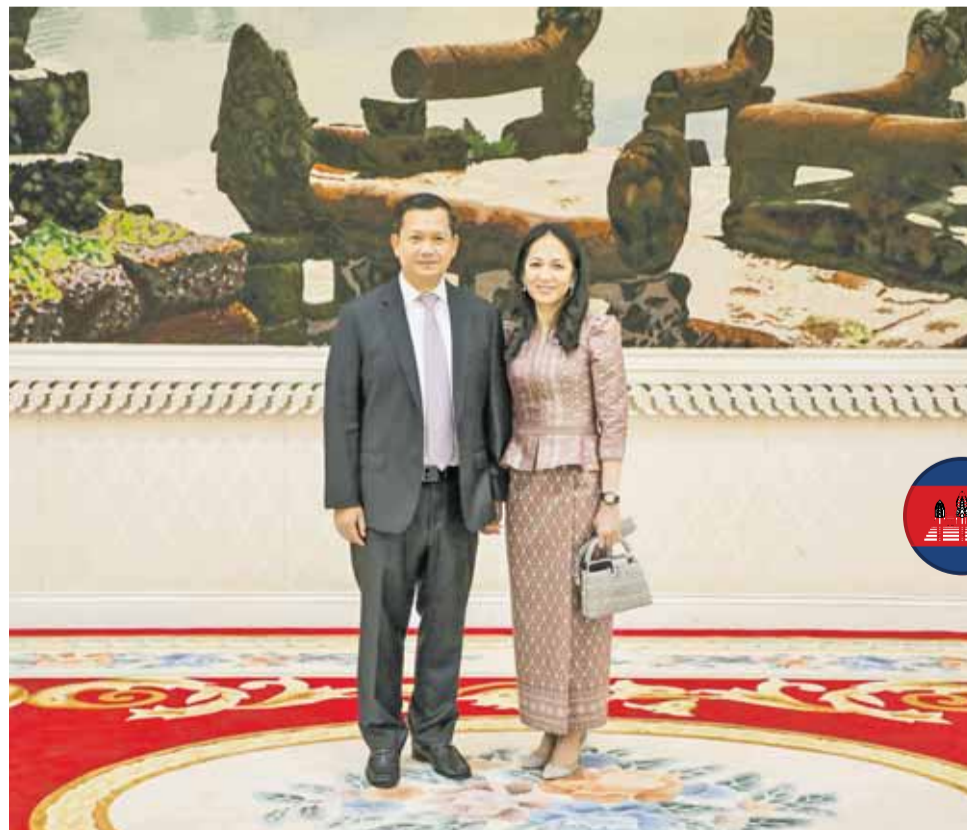
Hun Manet miniszterelnök és neje Phnom Penhben, idén márciusban

Hivatalba lépése óta Hun Manet még tovább szorította a főt-főt a független médián – ezt