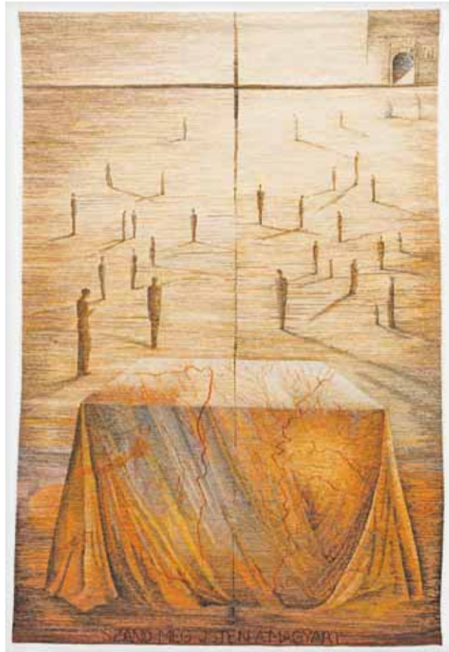
Gobelinteknikával szövött kárpit – Himnusz, Polgár Rózsa, 1996, Magyarország

elnevezést ráaggathattuk volna a vadállatra. Bodor gondolatmenete szerint rendelkezni kell valamiféle ősi sémakészlettel, a látottak feldolgozását segítő