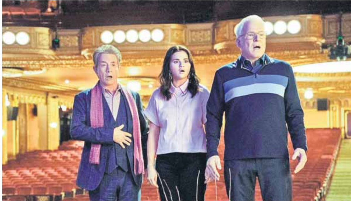
A trió (Martin Short, Selena Gomez és Steve Martin) most a Broadwayn nyomoz