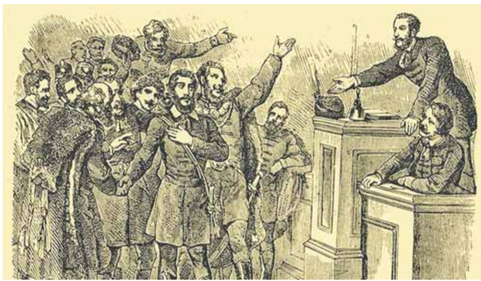
Kossuth Lajos kormányzóvá választása (korabeli metszet alapján)

elé, de nem talált lelkes fogadtatásra. Másnap, április 13-án az országgyűlés két házának közös, zárt ülésén igyekezett a törvényhozókat meggyőzni, de a többség itt sem támogatta. Kossuth jó érzékkel a nyilvánossághoz fordult, a képviselőház április 14-re kitűzött ülését a bevett gyakorlatól eltérően nem a debreceni református kollégium szűk oratóriumában, hanem a Nagytemplom akkora már zsúfolásig telt, hatalmas épületében tartatta meg.