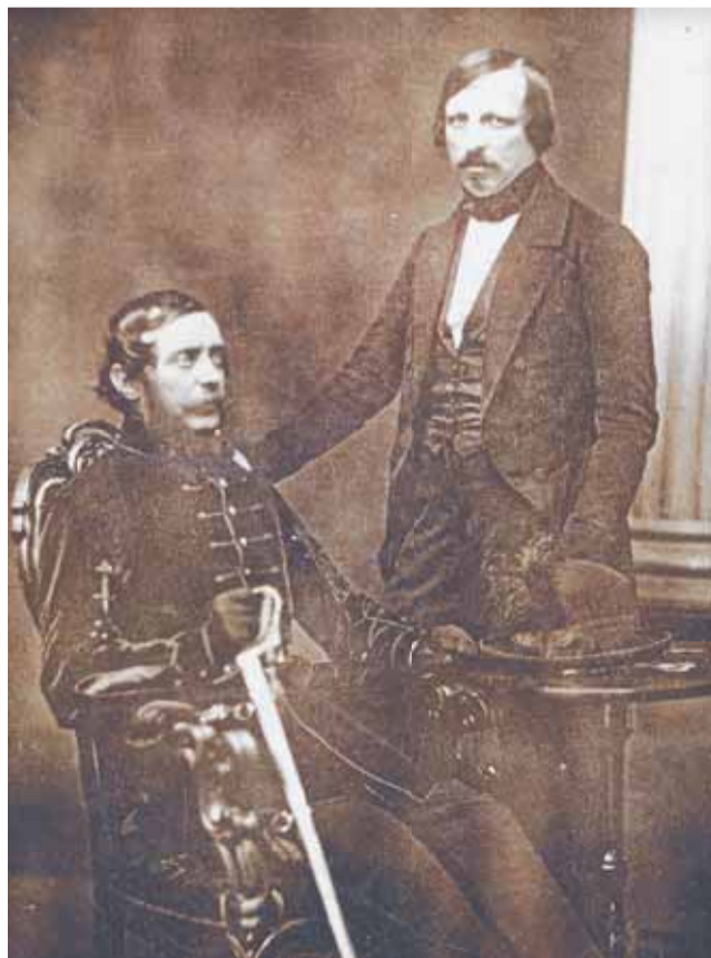
Kossuth Lajos és titkára, Pulszky Ferenc. A felvétel 1852-ben készült Bostonban.

Kossuth 1849. április 12-én terjesztette a Függetlenségi nyilatkozat első változatának szövegét az Országos Honvédelmi Bizottmány