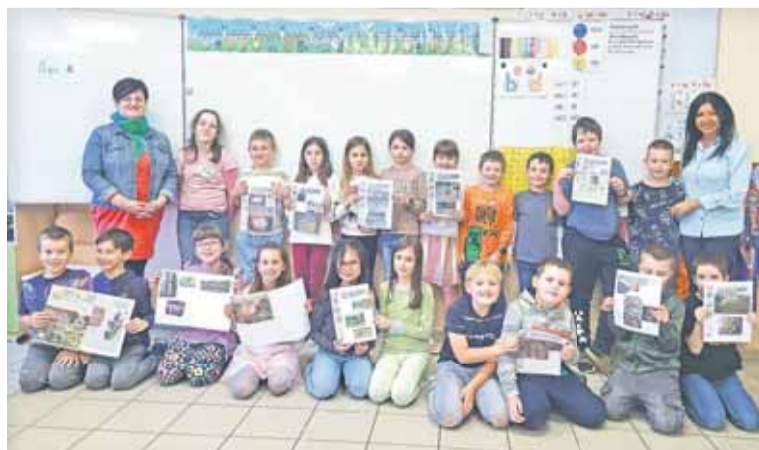
A pedagógusok visszajelzései alapján azóta két diák is bejelentette, hogy újságíró vagy lapszerkesztő szeretne lenni

Galánta. A gyerekeket az újságírás területéről főként az érdekelte, hogyan készül a lap, ki dönti el, hogy mi kerül a címlapra, honnan veszik az újságírók a témákat, a friss híreket, milyen papírból készül az újság, miért szürke az újságpapír és készülnek-e interjúk, riportok az iskolában. Egyikük afelől érdeklődött, hogy van-e cenzúra, majd a többieknek el is magyarázta, mit jelent ez a szó. Beszámolunk a 3. oldalon olvasható. (tb)