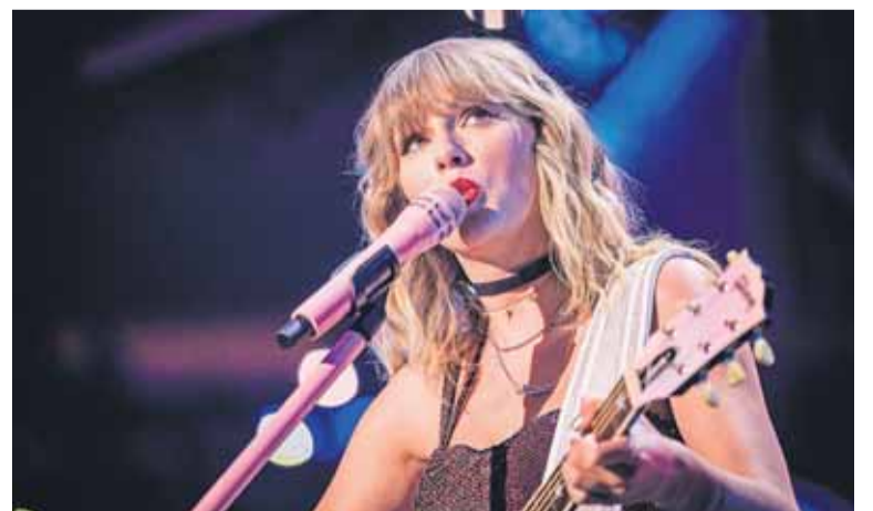
Swift április 19-re, azaz tegnapi harangozta be az album megjelenését, a dalok egy része azonban korábban kiszivárgott