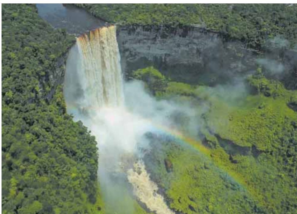
A Kaitour-vízesés a Potaro folyón – Essequibo régió, Guyana