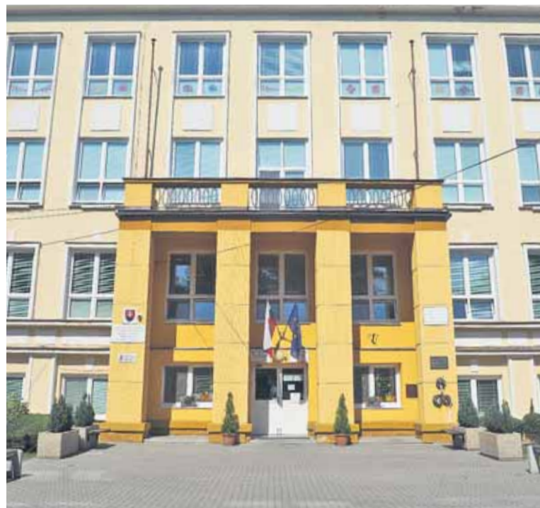
A játszóházzal egybekötött beíratási rendezvényt idén közel 150-en látogatták meg

testi és szellemi fejlettségnek jó megfelelnie egy elsősnek az iskolakezdéskor. Ilyenkor még fél év áll a szülőknél rendelkezésére, hogy ezeken, ha szükséges, alakítsanak. Idén először vezették be az értekezleteken az interaktív tábla használatát, a legfonto-